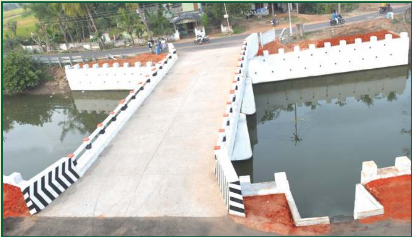
புதிய பாலம் அமைத்தல்