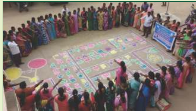
முழு சுகாதார தமிழகம் – முன்னோடி தமிழகம்