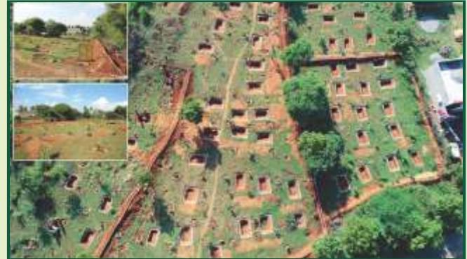
மகாத்மா காந்தி தேசிய ஊரக வேலை உறுதித் திட்ட செயல்பாடுகள்