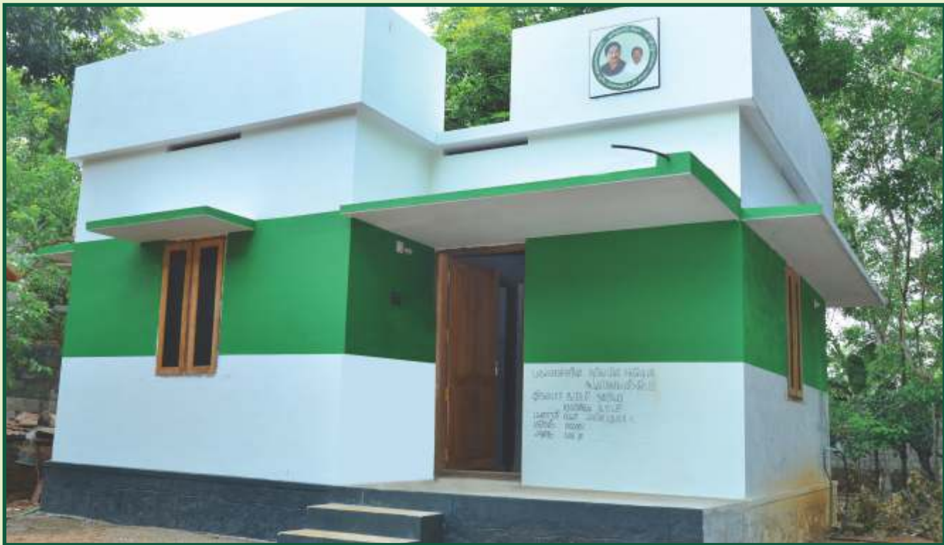
முதலமைச்சரின் சூரிய மின்சக்தியுடன் கூடிய பசுமை வீடு