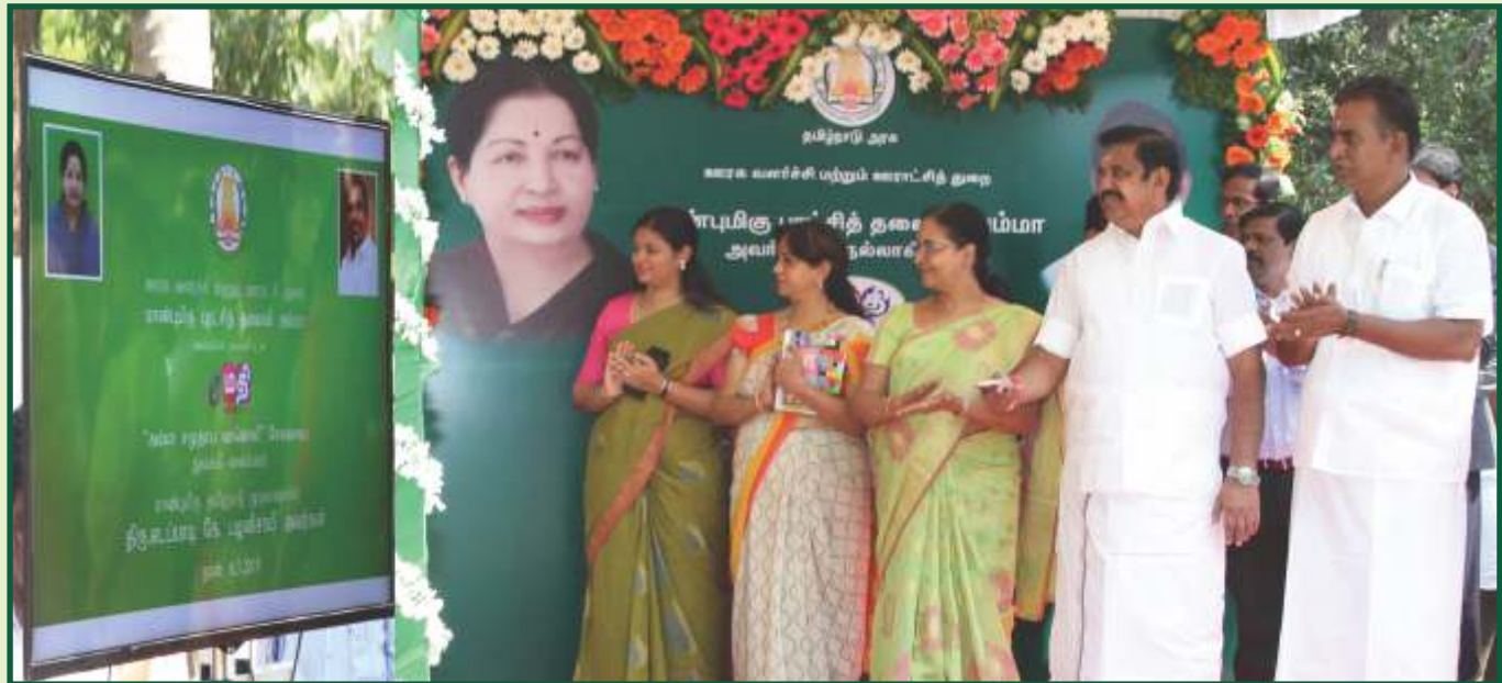
இ-மதி செயலி வாயிலாக சுய உதவிக் குழு உறுப்பினர்களுக்கான அம்மா சமுதாய வானொலி துவங்கப்பட்டது