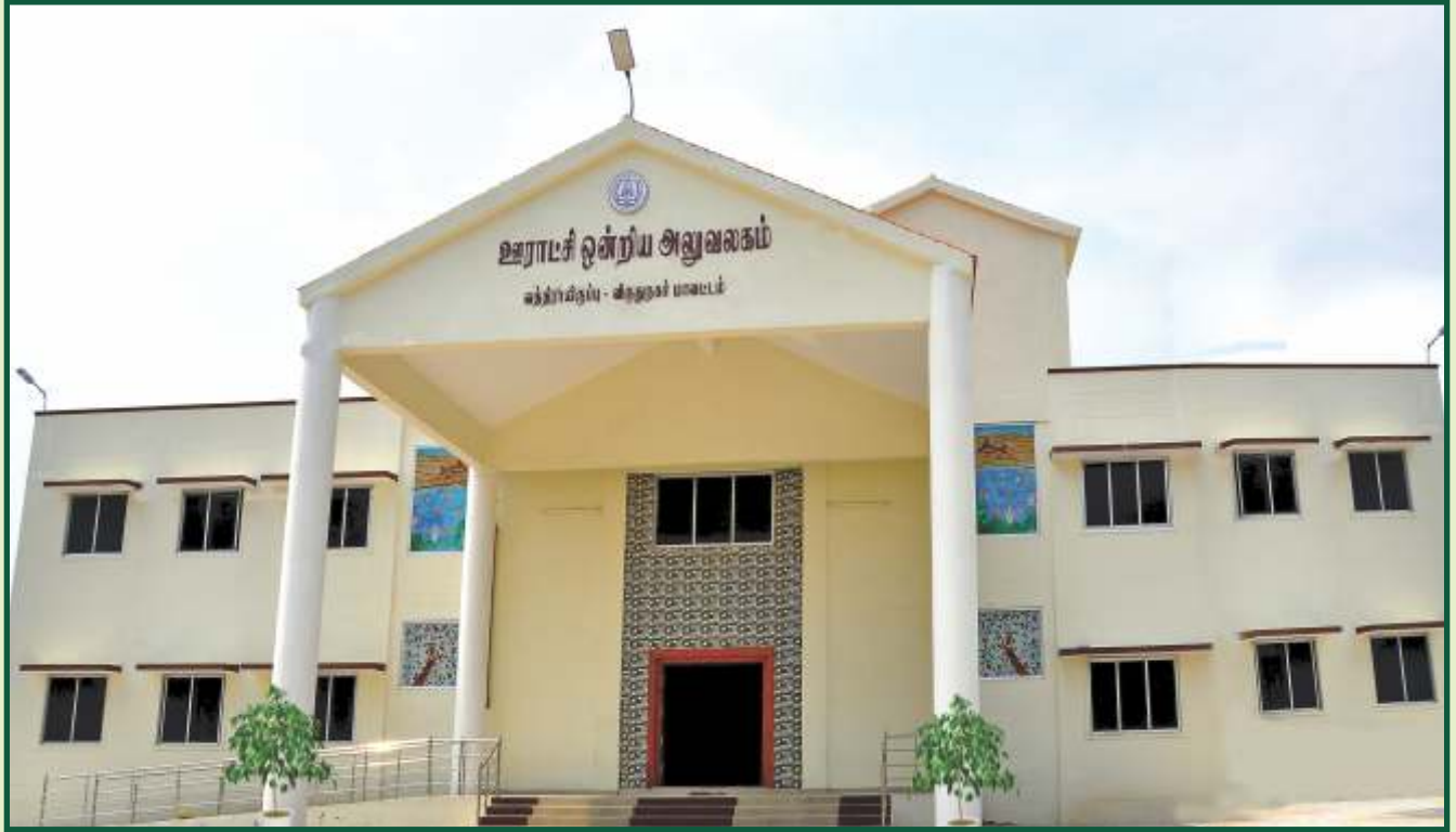
புதிய ஊராட்சி ஒன்றிய அலுவலகம்